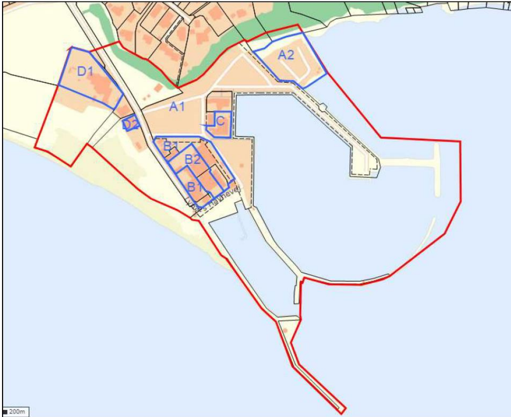
Habitatvurdering Kort 1: Lokalplanområdet.