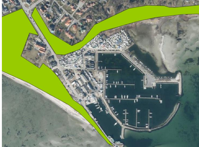
Kort 1: Kommuneplan 2013, naturbeskyttelsesinteresser.